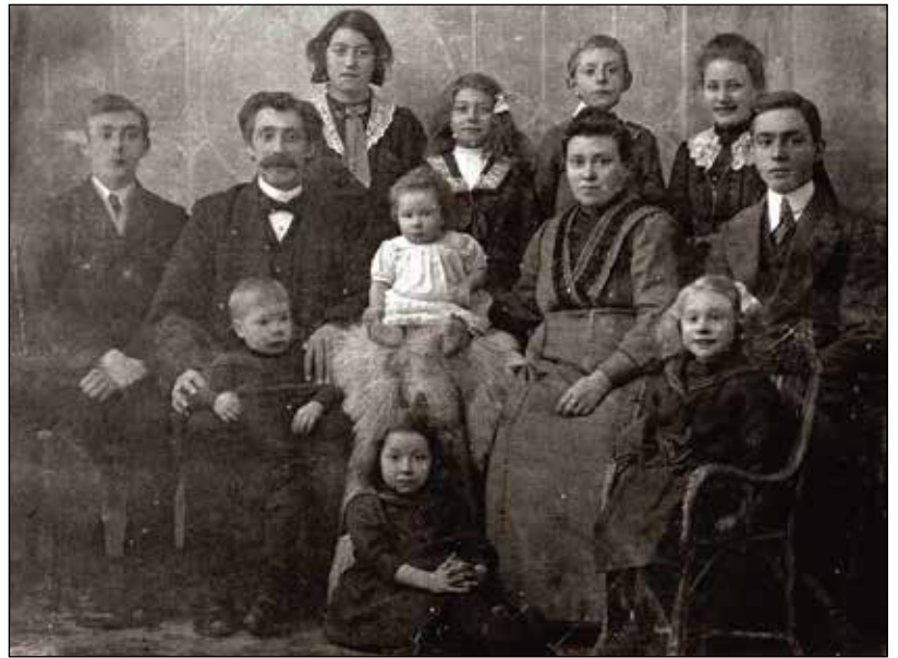
Waar wonen al die mensen met dezelfde achternaam als jij?

en Cees Heystek (voorzitter) houden deze lijst up-to-date. Op de website staat ook een lijst van alle bekende archieven per provincie waarvan de URL van de website bekend is. Vervolgens kies je het betreffende archief om nadere informatie te krijgen en eventueel naar de site te linken.