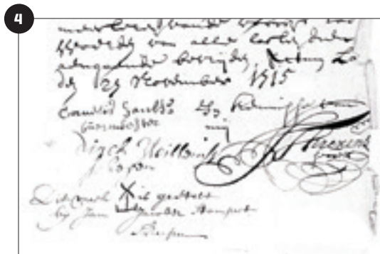
Ontcijferen van oude geschriften vergt de nodige kennis en geduld