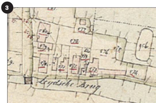
Kadastrale kaart van Ter Aar. Nummers relateren aan eigenaarsoppervlakte

Om te beginnen stellen de programma's een stamboom samen van de teruggevonden