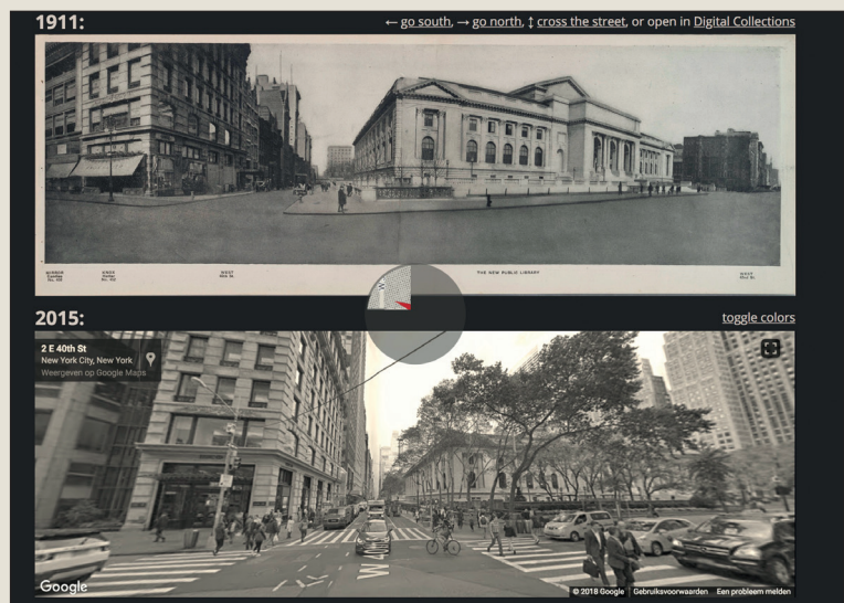
Fifth Avenue in New York in 1911, gereconstrueerd in Google Street View.

Nostalgisch ronddwalen in je eigen straat vanaf 1900? Dat zal er waarschijnlijk nooit in zitten. Toekomstige generaties die in ons verleden willen graven, hebben het straks een stuk makkelijker. Met de Historie-functie van Street View zijn afbeeldingen beschikbaar van locaties vanaf 2007. Geef een adres op op maps.google.nl , klik op de foto en kies een jaar bij de klok boven de afbeelding.